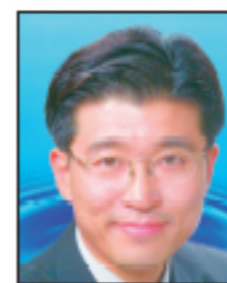
임명재 광주 서구 우리