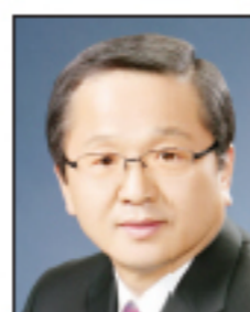
석희대 대전 서구 국민중심