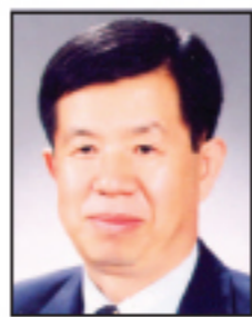
김사면 인천 비례대표 우리