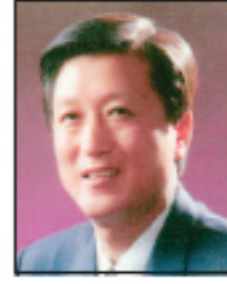
박원래 충남 논산시 한나라