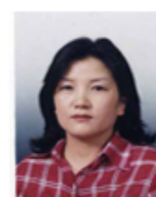
신현환 인천 비례대표 우리당