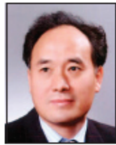
나성식 전남 나주시 우리