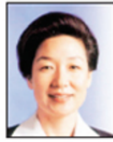
박희성 서울 비례대표 한나라