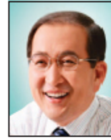
손석기 서울 강동구 우리