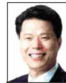
서명석 경기 부천시 우리