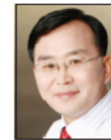
홍종성 경기 안산시 우리