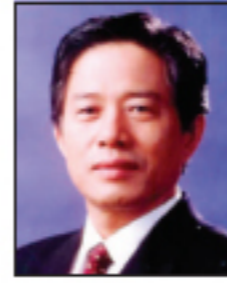
유준상 서울 동대문구 우리