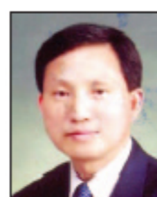
조양구 경남 함안군 한나라