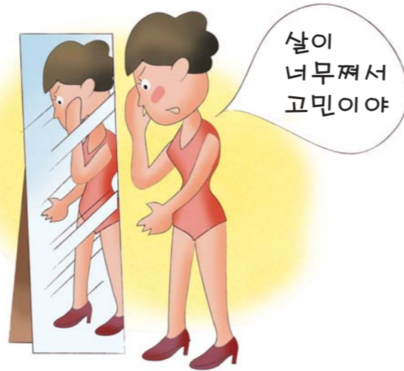
[체질량지수(BMI, kg/m 2 )]

국제보건기구(WHO) 기준에서는 체중(kg)을 키(m)의 제곱으로 나눈 체질량지수(Body Mass Index : BMI)가 30 kg/m 2 이상인 사람을 비만, BMI가 25~30 kg/m 2 이면 과체중이라고 정하고 있습니다.